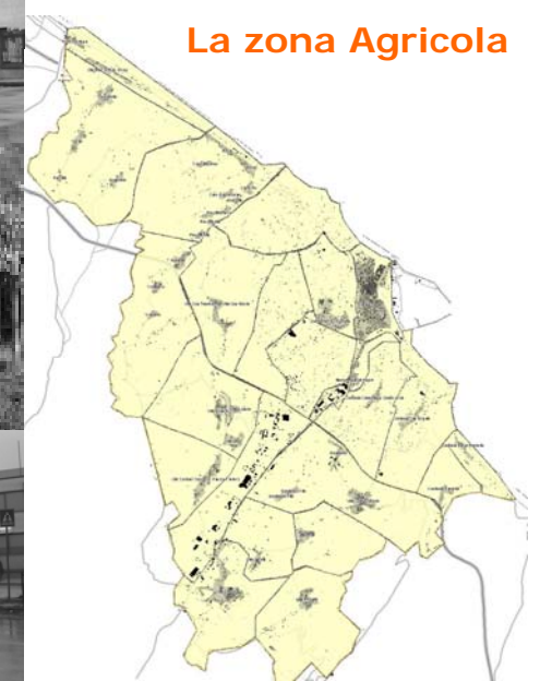
La zona Agricola