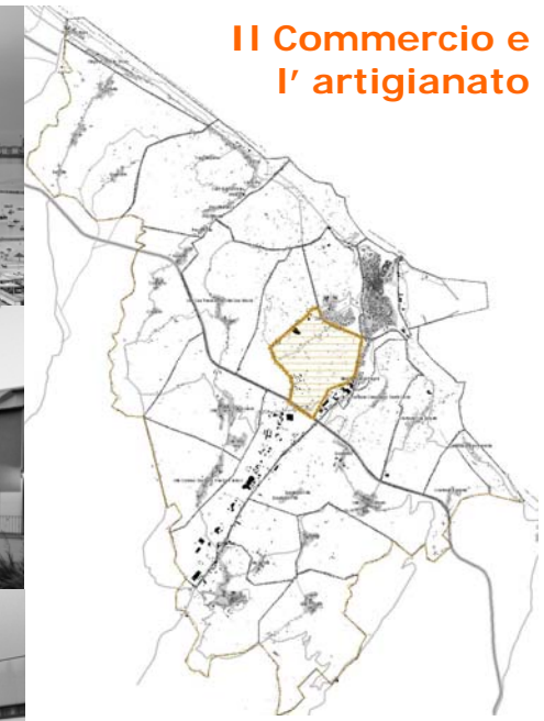
II Commercio e l'artigianato